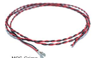
MQS Crimp contact